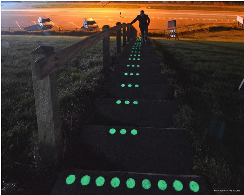
In het werk aangebrachte TG LumiWalk® trapmarkeringen